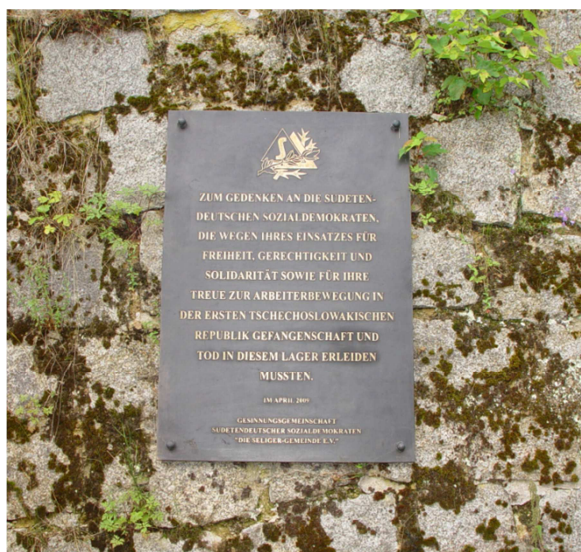
Pamětní deska sudetoněmeckým sociálním demokratům, červen 2009.

Společenství sudetoněmeckých sociálních demokratů Seligerovo sdružení“