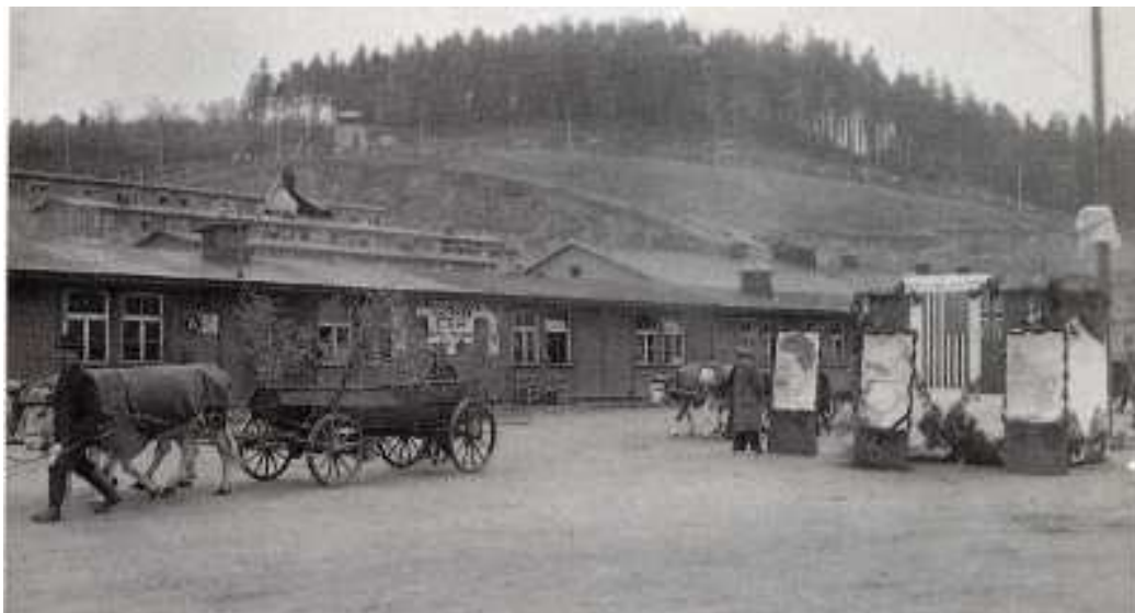
← Pohřební průvod pro vězně, kteří zemřeli po osvobození, na vyzdobeném apelplacu 3. května 1945

Po osvobození koncentračního tábora Flossenbürg armádou USA 23. dubna 1945 ztratil apelplac svou funkci. Vězni, kteří přežili, postavili uprostřed apelplacu řečnickou tribunu, vztyčili vlajky vítězných velmocí USA, Velké Británie a Sovětského svazu a vystavili zde portréty hlavních představitelů těchto zemí v životní velikosti. Na apelplacu se pak konalo několik oslav osvobození.