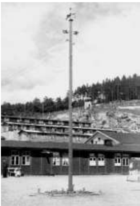
← Apelploc se stojákem na osvětlení, po roce 1945

Od roku 1945 do roku 1947 byl bývalý apelploc součástí amerického zajateckého tábora pro Němce a tábora Organizace pro uprchlíky při OSN, UNRRA (United Nations Relief and Rehabilitation Administration) pro takzvané Displaced Persons („DPs“ = cizí státní příslušníci, kteří se po skončení války ještě zdržovali v Německu). V této době sloužil apelploc uvězněným Němcům jako sportoviště.