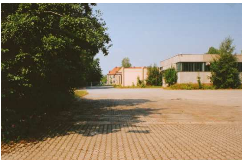
Průmyslové haly na bývalém apelplacu, 90. léta 20. století.

Jako poslední využívala tovární halu stojící přímo uprostřed apelplacu telekomunikační firma, jejíž vedení se později rozhodlo své sídlo přesunout jinam právě kvůli jeho poloze. V roce 1998 tak přenechala pozemek i halu Bavorskému státu pod podmínkou, že bude areál po stržení tovární haly připojen k Památníku. Od té doby mohou návštěvníci vstupovat také do prostoru apelplacu, který je dnes centrálním místem Památníku.