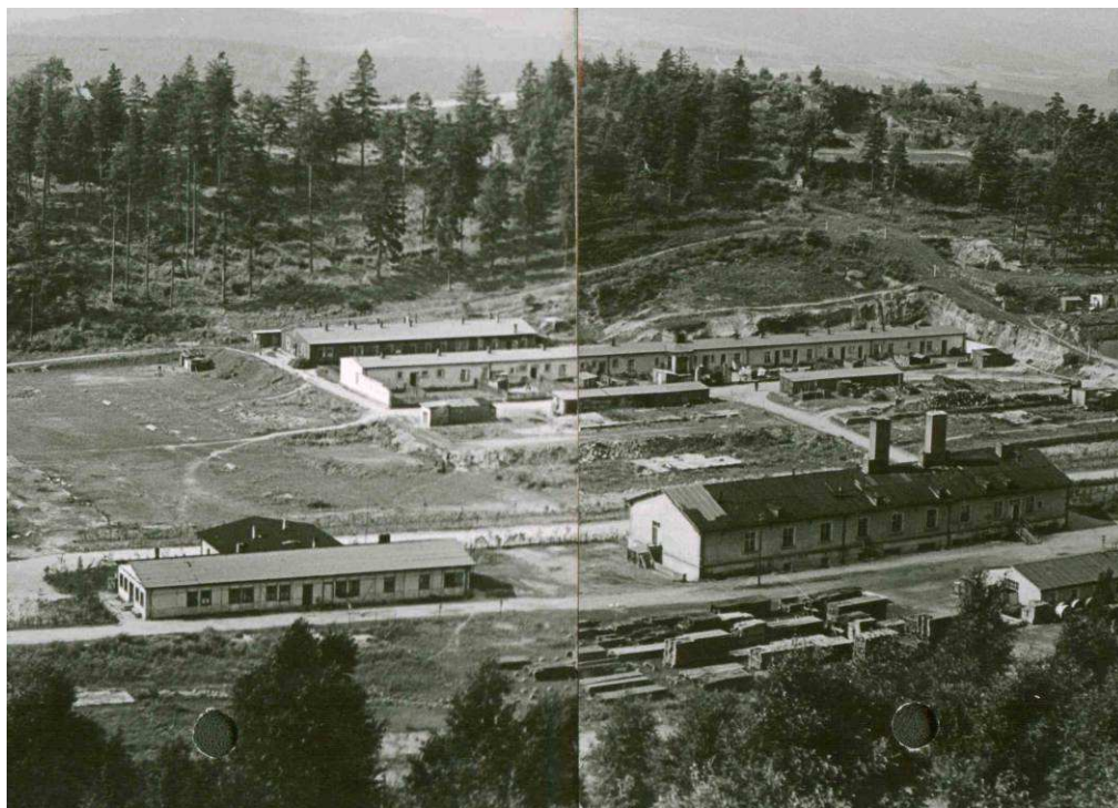
← Areál tábora v 50. letech 20. století (Část panoramatické fotografie).

Stejně jako ostatní baráky byly i nemocniční baráky do roku 1950 postupně strženy. V roce 2001 nechal Památník základy těchto budov odkryt a zdokumentovat. Dnes je možné vidět už jen základy jednotlivých baráků.