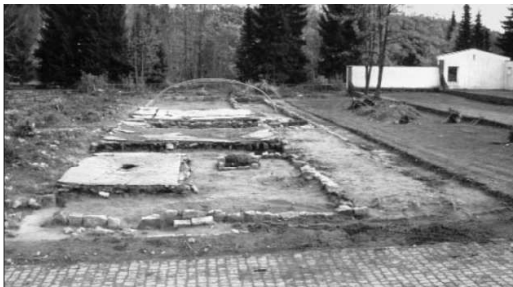
← Odkryté základy podávají obraz o původním rozdělení místností v nemocničním baráku