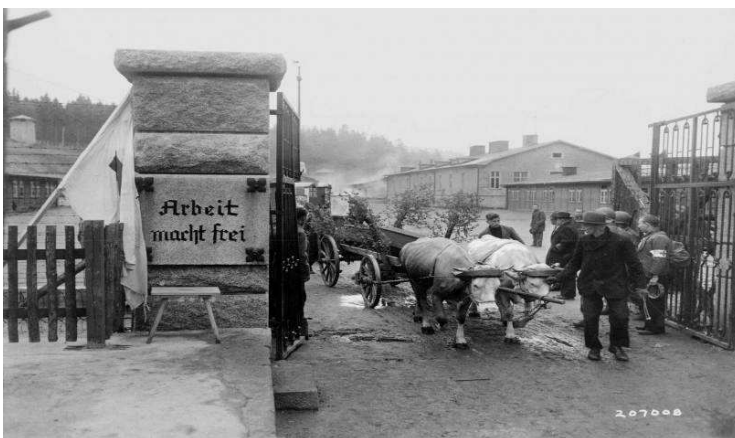
Převoz vězně zesnulého po osvobození tábora, 3. května 1945

V roce 1943 se plánovalo rozšíření vězeňského tábora o jednu řadu baráků, v nichž byly ubytovány hlídky SS. Ty se měly přestěhovat do nových kasáren. Proto se také stavěla nová kamenná budova velitelství, která měla být novým hlavním vchodem do prostoru tábora. Toto rozšíření tábora nakonec nebylo uskutečněno a dřevěný strážní domek, původně zamýšlený jako provizorium, nadále plnil svou funkci.