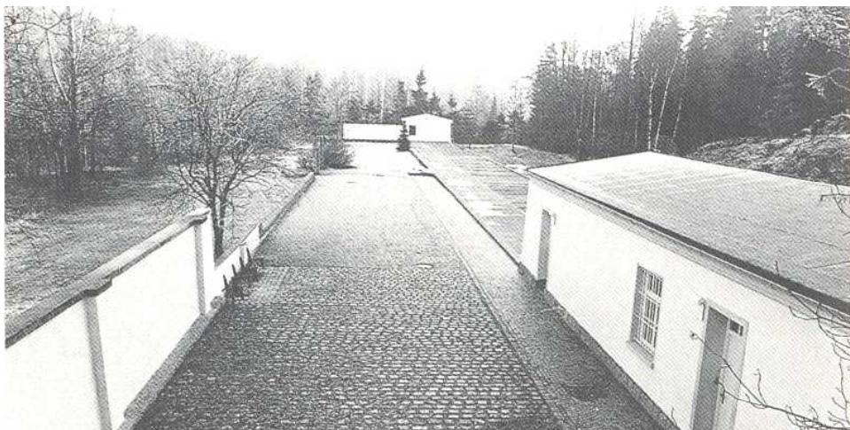
Zachovalá část bývalé táborové věznice, 1988.

Realizací této malé expozice byl pověřen Památník koncentračního tábora Dachau, který měl tehdy na rozdíl od Památníku Flossenbürg vlastní zaměstnance. V roce 1985 byla výstava naposledy přepracována a v roce 2008 odstraněna, poté co byla rok předtím v budově vězeňské prádelny otevřena nová rozsáhlá stálá expozice.