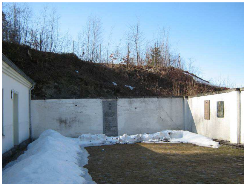
← Dvůr táborové věznice s pamětními deskami, březen 2009.