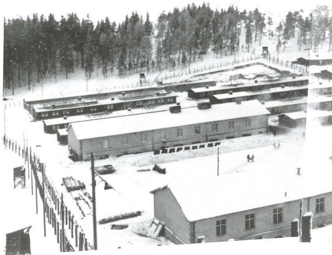
Pohled přes areál koncentračního tábora (výřez), zima 1939/40, Foto: soukromá sbírka.

V době vzniku koncentračního tábora Flossenbürg od května 1938 byli vězni nuceni zbudovat vězeňské baráky a provozní budovy tábora. Koncem roku 1939 dokončili prádelnu a vězeňskou kuchyni. Od počátku roku 1940 byly tyto dvě kamenné budovy, které se nacházely po obou stranách apelpacu, využívány ke svým účelům.