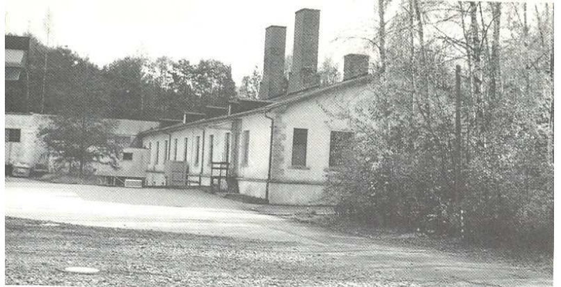
Věžeňská prádelna využívaná jako kancelářská budova, 1988.

Od poloviny 50. let se na apelplacu a v okolních budovách usídlily průmyslové podniky. V roce 1964 byla bývalá budova prádelny jakožto průmyslová hala stavebně propojena s věžeňskou kuchyní. V průběhu dalších desetiletí se budova prádelny využívala mimo jiné pro kanceláře firem, které v areálu vyráběly hračky, součástky do automobilů a mobilní telefony.