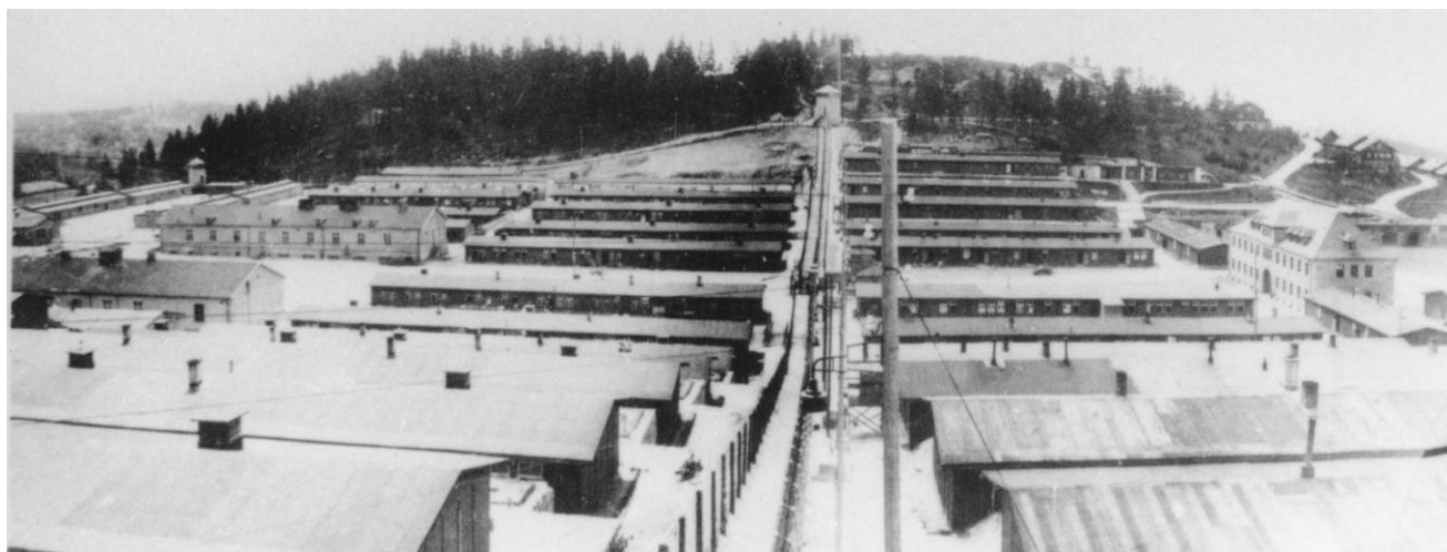
Osa dělicí tábor od severu k jihu, 1945

Vězeňské baráky se v koncentračním táboře Flossenbürg nacházely po obou stranách apelplacu na terasách ve svahu kopce. V roce 1938, kdy byl tábor založen, bylo postaveno deset baráků. Mnohé z nich nebyly od samého počátku využívány jako ubytovny pro vězně, ale sloužily k různým jiným účelům, např. jako dílny nebo jako marodka pro nemocné. Později přibýly další baráky. Všechny stavby byly výsledkem nucené práce vězňů.