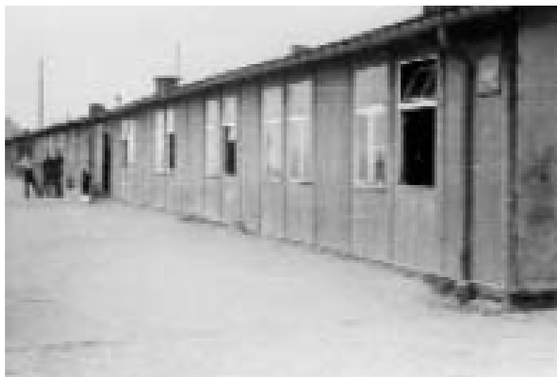
← Vězeňský barák, květen 1945

Každý blok byl pod dozorem jednoho vězně vybraného příslušníky SS, což byl tzv. staršina bloku (také blokař, Blockälteste). Z pověření vedení tábora tento vězeň dohlížel na pořádek na baráku, často i za použití násilí. Ve Flossenbürgu vykonávali tuto funkci především ti vězni, kteří byli SS označeni jako kriminálníci.