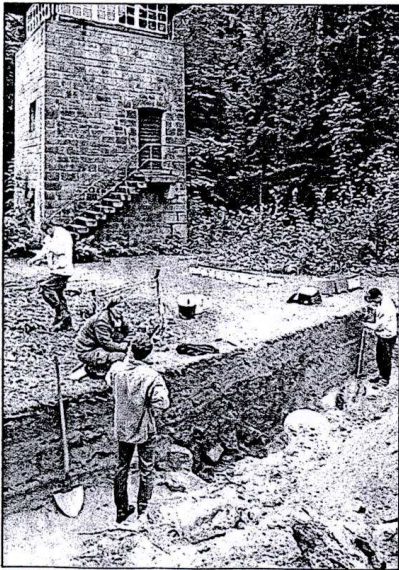
Den Ort, an dem die Leichen auf die Wagen verladen wurden, legen Archäologen derzeit wieder frei.

Nicht zu vergessen sei auf einen weiteren Aspekt. So gehe es darum, die Anlage wichtiger Einrichtungen und damit auch Strukturen des Lagers wieder deutlich zu machen. Skriebeleit