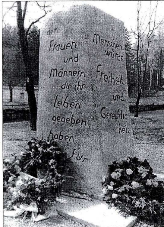
DIE GEDENKSTÄTTE FLOSSENBÜRG umfaßt bisher nicht das gesamte Gelände des ehemaligen Konzentrationslagers. Das wollen ehemalige Häftlinge ändern und hoffen auf das Kultusministerium.